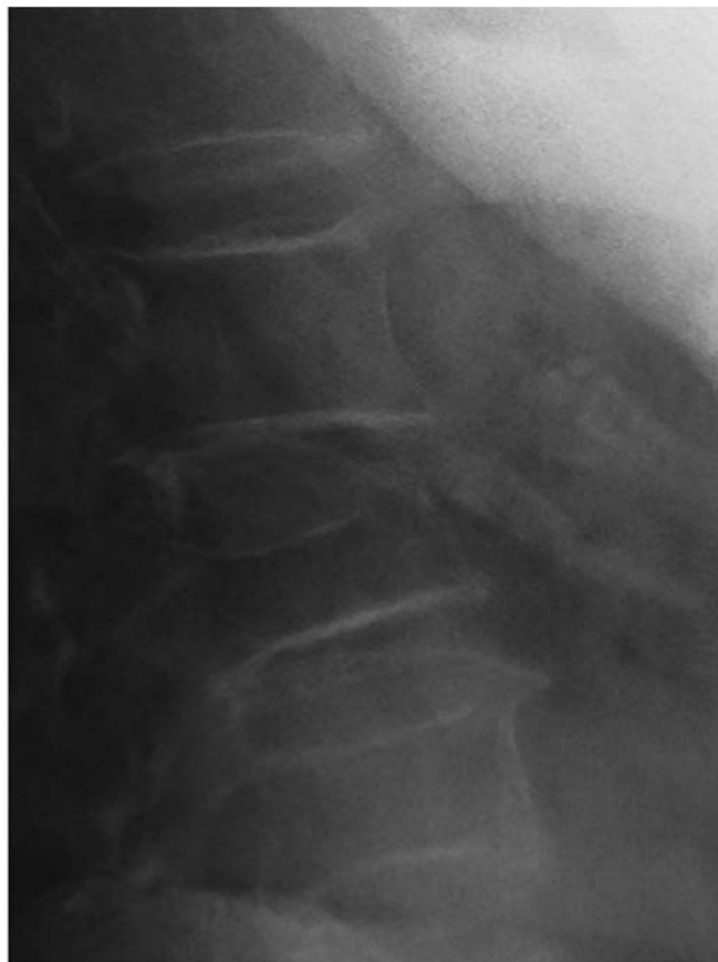
Figura 1. Fractura vertebral.

Otras técnicas de imagen no se utilizan en la práctica clínica diaria, pero pueden emplearse para el momento del