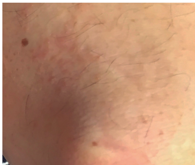
Figura 2. Se pueden apreciar lesiones vesiculares pruriginosas de aspecto y disposición herpetiforme, típicas de la dermatitis herpetiforme.